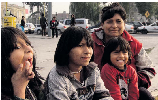
Straatartiesten met moeder